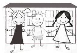
Специјална школа „Миодраг В. Матић“ Ужице