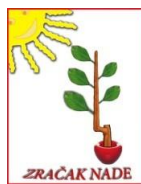
Удружење родитеља деце са сметњама „Зрак наде“ Пљевља